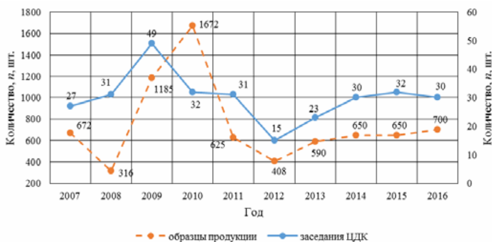
Рис. 4. Количество заседаний ЦДК и рассмотренных образцов продукции

За 2007-2016 гг. проведено более 270 заседаний ЦДК, на которых было рассмотрено около 7000 образцов пищевой продукции (рис. 4).