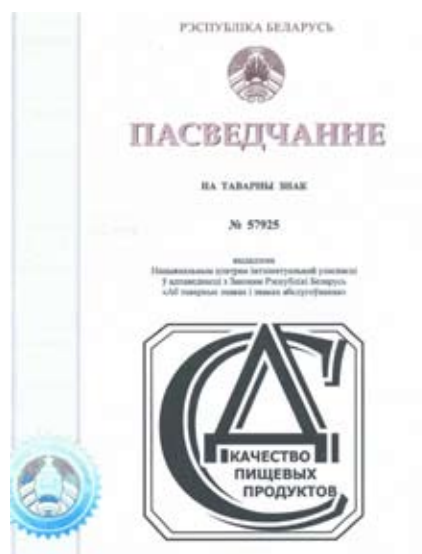
Рис. 5. Товарный знак качества

Для улучшения качества работы всей организации в РУП «Научно-практический центр Национальной академии наук Беларуси по продовольствию» была разработана и внедрена система менеджмента качества, сертифицированная на соответствие требованиям СТБ ISO 9001 «Системы менеджмента качества. Требования».