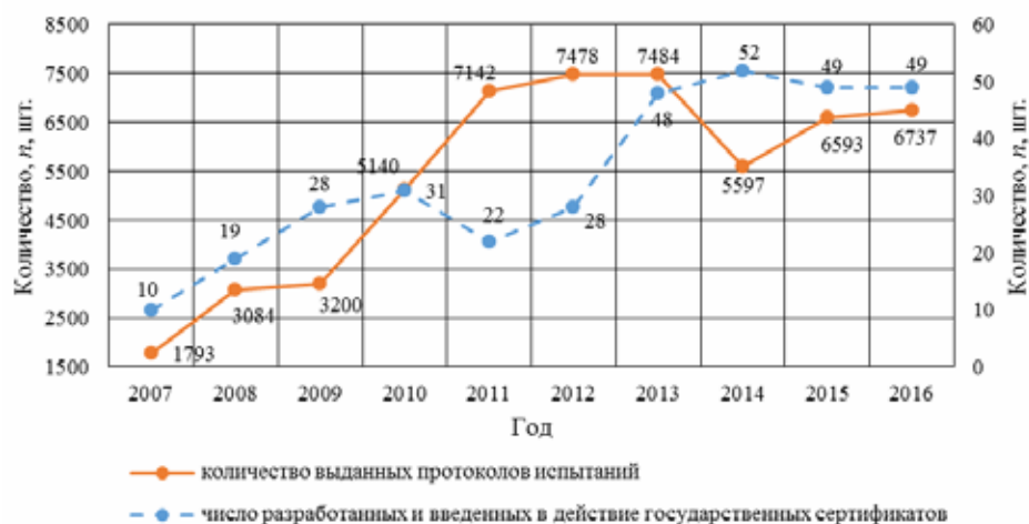
Рис. 2. Количество выданных протоколов испытаний, число разработанных и введенных в действие государственных стандартов на методы испытаний

В целях защиты отечественного рынка пищевых продуктов от недоброкачественной и фальсифицированной продукции на базе РУП «Научно-практический центр Национальной академии наук Беларуси по продовольствию» был создан Республиканский контрольно-испытательный комплекс по качеству и безопасности продуктов питания (далее – РКИК). Основной целью РКИК является совершенствование системы контроля качества и безопасности, разработка методов и методик контроля, установление подлинности и выявление фальсификации пищевых продуктов, проведение лабораторных исследований с выдачей протоколов испытаний и др.