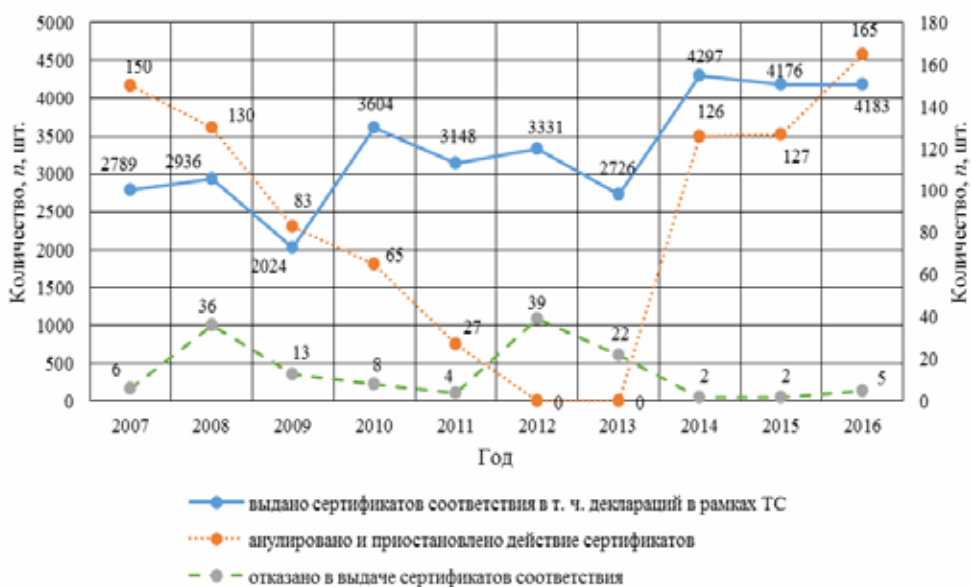
Рис. 3. Количество выданных сертификатов и деклараций

Для получения сертификата соответствия или декларации на продукцию, позволяющих осуществлять продажу пищевых продуктов, необходимо пройти процедуру подтверждения в Органе по сертификации пищевой и парфюмерно-косметической продукции. В сферу компетенции органа входит сертификация продукции на соответствие требованиям национальных стандартов и менеджмента качества в соответствии с требованиями СТБ ISO 9001 «Системы менеджмента качества. Требования» и подготовка их к сертификации (рис. 3) [2].