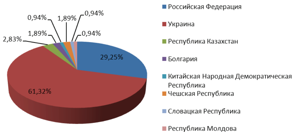
Рис. 2. Статьи зарубежных авторов, опубликованные в журнале «Пищевая промышленность: наука и технологии» в 2008–2018 гг. (в процентном соотношении, по странам)

На долю зарубежных авторов, представленных учеными из восьми стран, приходится 14 % научных статей. Среди публикаций небелорусских ученых преобладающее место занимают авторы из Украины и Российской Федерации – 61,32 % и 29,25 % от общего количества зарубежных авторов соответственно (рис. 2).