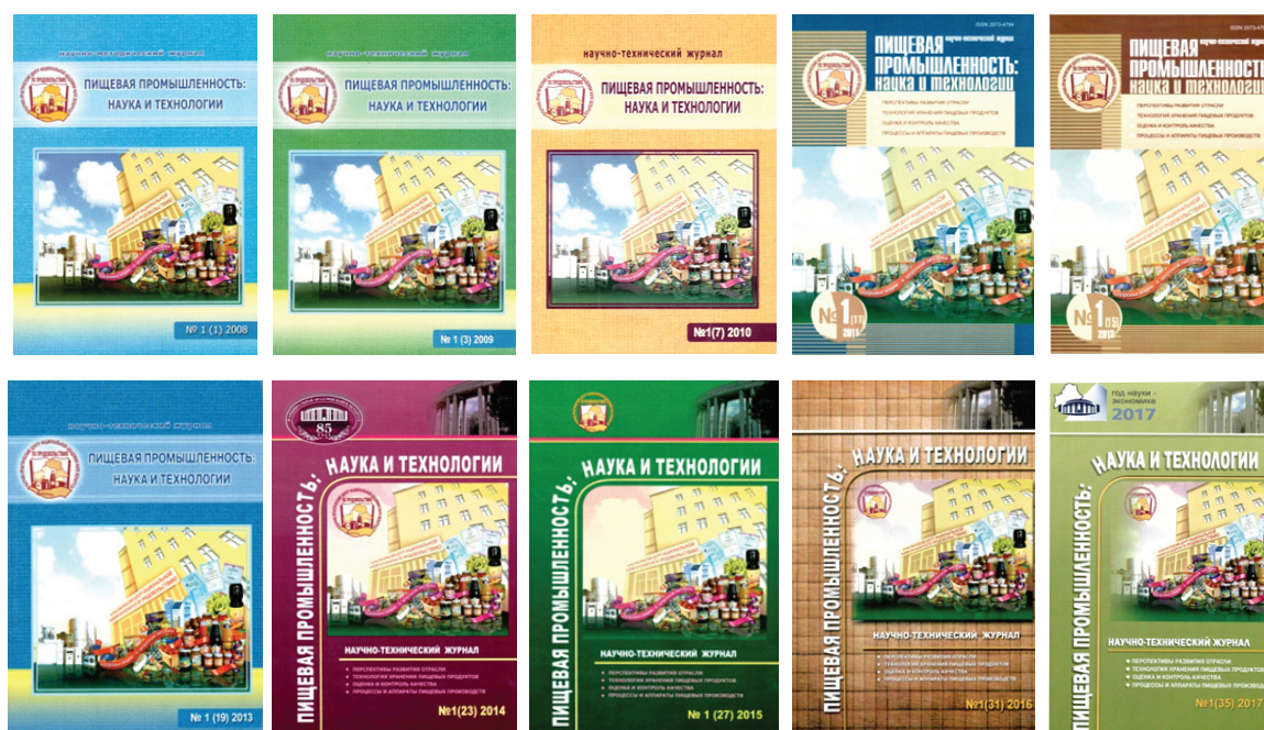
Рис. 1. Журнал «Пищевая промышленность: наука и технологии» в 2008–2017 гг. Fig. 1. The magazine “Food industry: science and technology” in 2008–2017

С 2011 года журнал включен в Перечень научных изданий Республики Беларусь, рекомендованных для опубликования результатов диссертационных исследований в области пищевой промышленности. С 2013 года издание включено в наукометрическую базу данных «Российский индекс научного цитирования» (РИНЦ). Научные статьи размещаются в РИНЦ после выхода номера в свет, что позволяет повысить рейтинг научного цитирования авторов и их материалов.