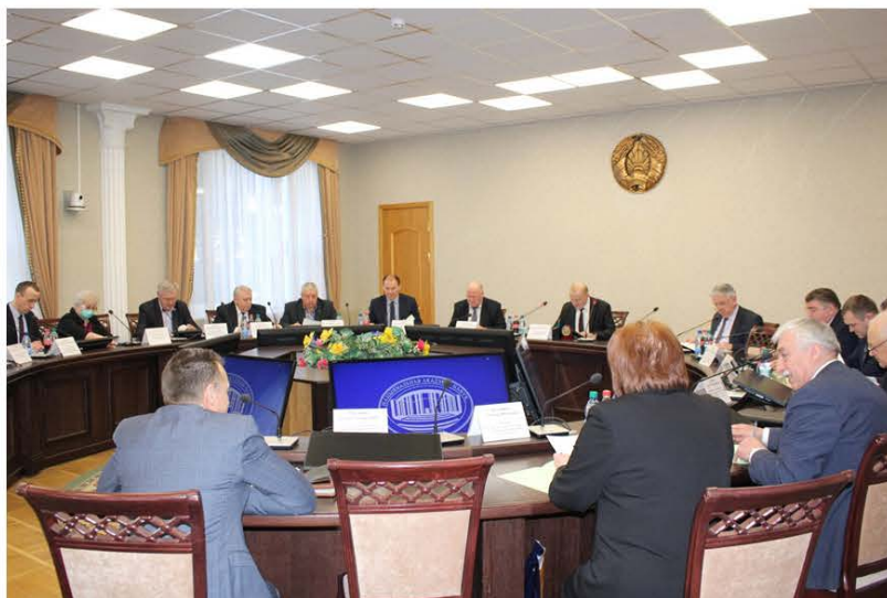
Рис. 1. Заседание Межведомственного координационного совета по проблемам питания при Национальной академии наук Беларуси по продовольствию

Совет возглавляет Председатель Президиума Национальной академии наук Беларуси.