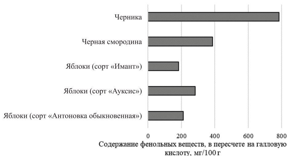
Рис. 1. Общее содержание фенольных соединений в фруктовом сырье Fig. 1. The total content of phenolic compounds in fruit raw materials

Оценка воздействия способов обработки проводилась на примере яблок с большим содержанием фенольных веществ в пересчете на сухое вещество (рис. 2).