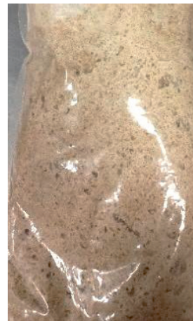
Образец № 2 Молочнокислые бактерии: L. brevis -14, L. plantarum -M53, Weissella sibirica -M58, Дрожжи: Candida milleri