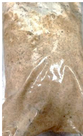
Контрольный образец Молочнокислые бактерии: L. paracasei -5, L. paracasei/casei -63, L. plantarum -78, Дрожжи: Candida milleri

трольного образца. Установлено, что при температурах 20 °С и 18 °С значения титруемой кислотности исследуемых композиций превышали показатели контроля (9,0 °Н и 8,6 °Н) на 1,2–2,8 °Н и 0,4–1,2 °Н соответственно. Показатели подъемной силы составили 19–25 мин при 20 °С и 20–25 мин при 18 °С, что подтверждает сохранение высокой газообразующей активности микробиоты в условиях консервации, в то время как в контрольном образце данные значения составили 23 и 24 мин соответственно.