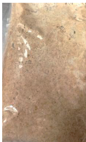
Образец № 4 Молочнокислые бактерии: L. brevis -11, L. brevis -20, L. plantarum -M63, Дрожжи: Candida milleri