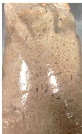
Образец № 3 Молочнокислые бактерии: L. brevis -13, L. fermentum -M56, L. paraplantarum -M62, Дрожжи: Candida milleri