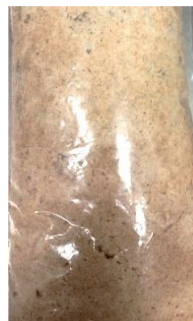
Образец № 5 Молочнокислые бактерии: L. brevis -14, Weissella sibirica -M58, L. plantarum -M63, Дрожжи: Candida milleri